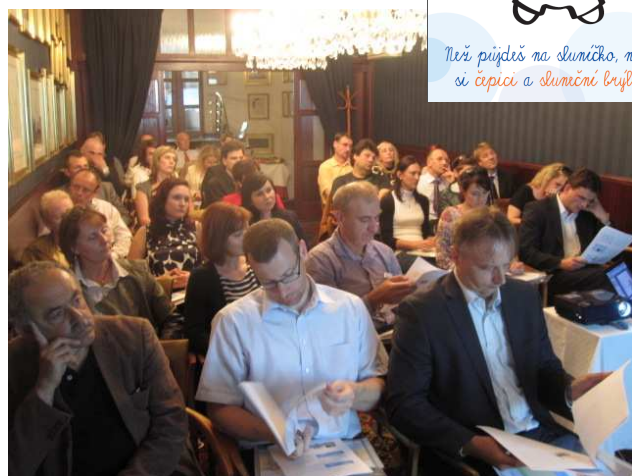
Zástupci firem, kteří se zúčastnili setkání s ČADV v hotelu Hoffmeister