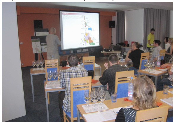
Someliérský kurz – Plzeň