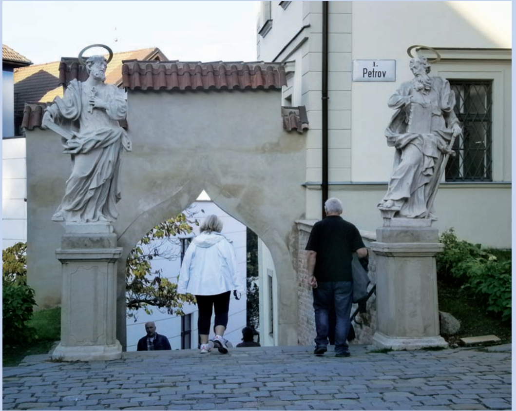
Z Petrova nashledanou a příjemné Vánoce