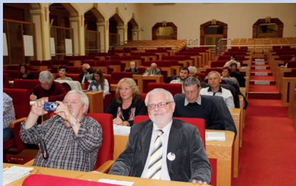
Konference o Lupence Magistrát hl.m. Praha