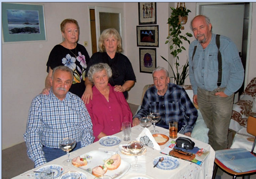
Návštěva u Hejlů v Roztokách