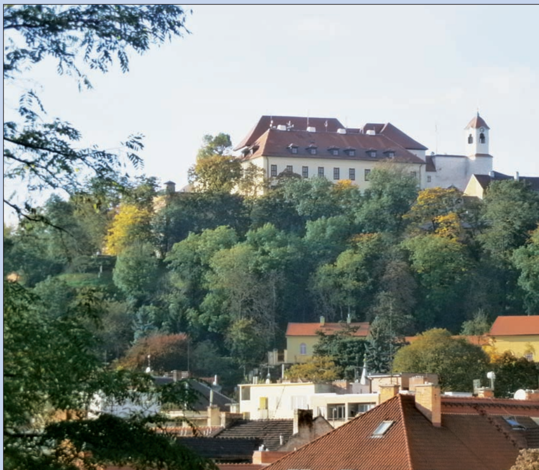
byl jednou jeden hrad – v Brně